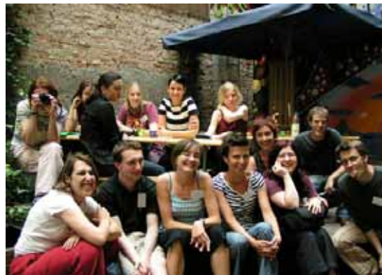
TeilnehmerInnen des Polnisch-Israelisch-Deutschen Jugendprojekts

Wrocław ist einer der angenehmsten Orte, an denen ich je länger