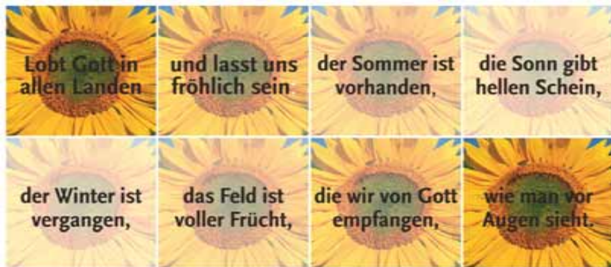
(Evangelisches Gesangbuch 500, Martin Behm)