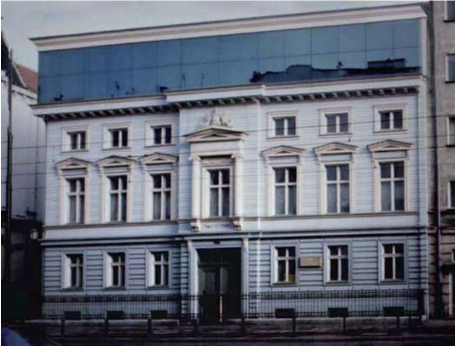
Das Edith-Stein Haus

Im ehemaligen Wohnhaus der Familie Stein befindet sich seit einem Jahr nicht nur eine Bibliothek und das Büro der Edith-Stein-Gesellschaft, sondern auch eine Programmabteilung, die sich als wichtigste Ziele, ebenso wie die Edith-Stein-Gesellschaft, die deutsch-polnische Versöhnung und den christlich-jüdischen Dialog gesetzt hat.