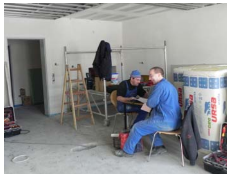
Bild oben: Noch sind die Handwerker fleißig, aber schon in vier Wochen soll alles fertig sein.

Bild rechts: Bald ist der neue Anbau fertig. Tyler hält schon mal nach neuen Kindern Ausschau.