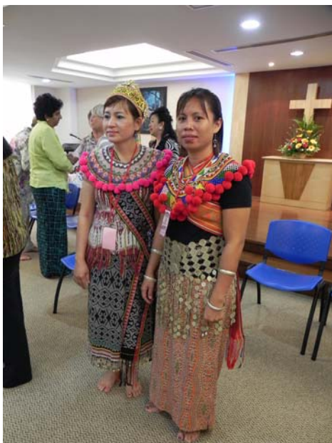
2 Frauen des WGT Komitee von der Insel Borneo in ihrer Tracht