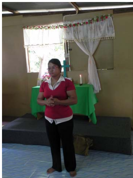
Pfarrerin der indigenen "Orang Asli" in ihrer Dorfkirche

Mehr über Malaysia erfahren Sie bei den Vorbereitungsveranstaltungen: